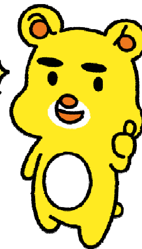
株式会社アベニュー マスコットキャラクター にゅ〜た