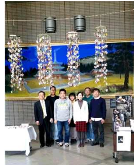
こちらが「多賀城市文化センター」

※ご協力頂いた「蝶と桜のオーナメント」の総数は500枚でした。お預かりしたオーナメントは、ギャラリー・シンさんへお送りさせていただきました。その後、さんさん商店街や多賀城市文化センターに飾られています。