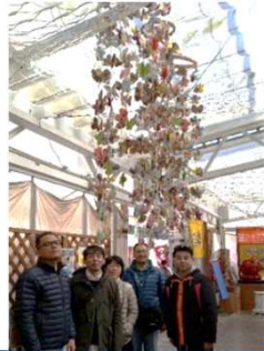
さんさん商店街に飾られた、蝶と桜のオーナメント