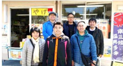
こちらが「さんさん商店街」