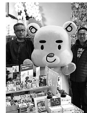
商店街にある「わたや」さん、お世話になりました。