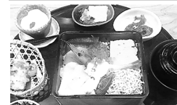
キラキラ丼、おいしかったです。