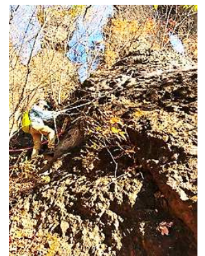
【妙義山の崖を登る私】

「紅葉を見たい」という思いから、この1ヶ月の間に、中禅寺湖畔にある「社山(しゃざん)」という山と、群馬の「妙義山」に行ってきました。 「社山」は、ガイドブックには初級者向けになっていたのですが、かなりハードな山で、筋肉痛に苦しみました。「妙義山」は岩山で、鎖をつかみながら崖を登る箇所がたくさんあり、大変そうではあるのですが、体力的にはそんなにキツくありませんでした。 肝心の紅葉は、「妙義山」はピークを少し過ぎていましたが、「社山」は素晴らしかったです。中禅寺湖を眼下に見ながら、正面には男体山がそびえ、中禅寺湖畔の紅葉は見事でした。