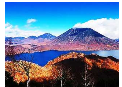
【中禅寺湖と男体山】